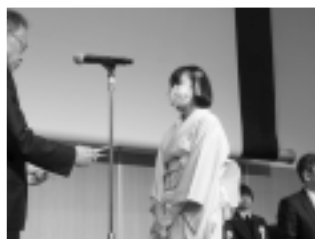
一般の部・優秀賞 しののめさん